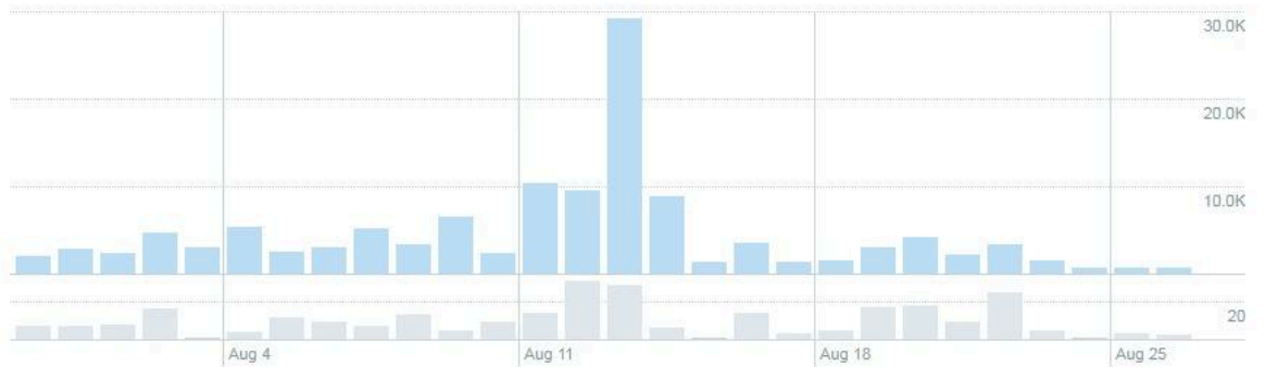
Sus Tweets consiguieron 128.3K impresiones en este período de 28 días

Las publicaciones de Twitter en el período 30 de Julio a 26 de Agosto de 2019 (28 días) han tenido 128.300 impresiones.